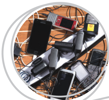
Typowy obrazek z współczesnego jachtu - tuż po zacumowaniu...

Współczesne urządzenia mobilne mają coraz większy apetyt na energię. Mimo niezwykłego postępu w rozwoju baterii, ciężko znaleźć smartfon, który przy umiarkowanym użytkowaniu jest w stanie pracować bez ładowania więcej niż dobę. Ten sam problem dotyczy mobilnych GPS, konsoli do gier, tabletów. Nawet relatywnie mało łakome na energię czytniki e-booków, potrzebują ładowania co parę dni.